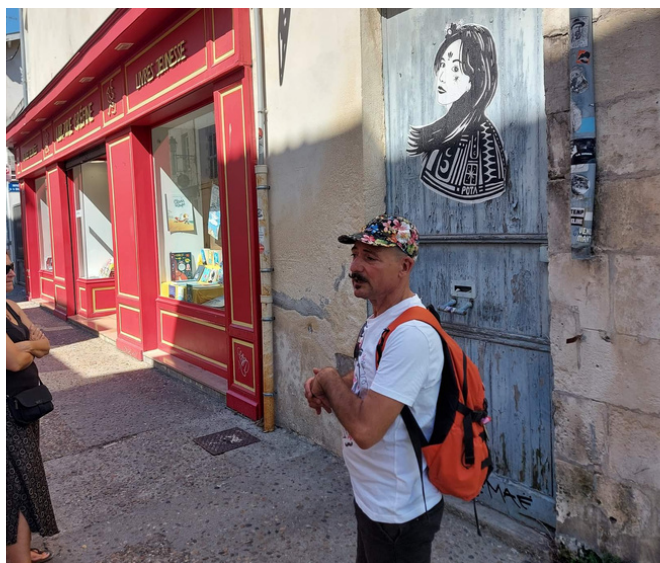
Rue Saint Nicolas- La Rochelle- Les balades Z'urbaines de LR avec DominiCK - Collage Pota