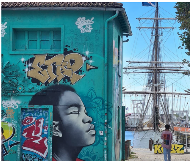
AjSpot du Gabut- Les balades Z'urbaines de LR - ETE